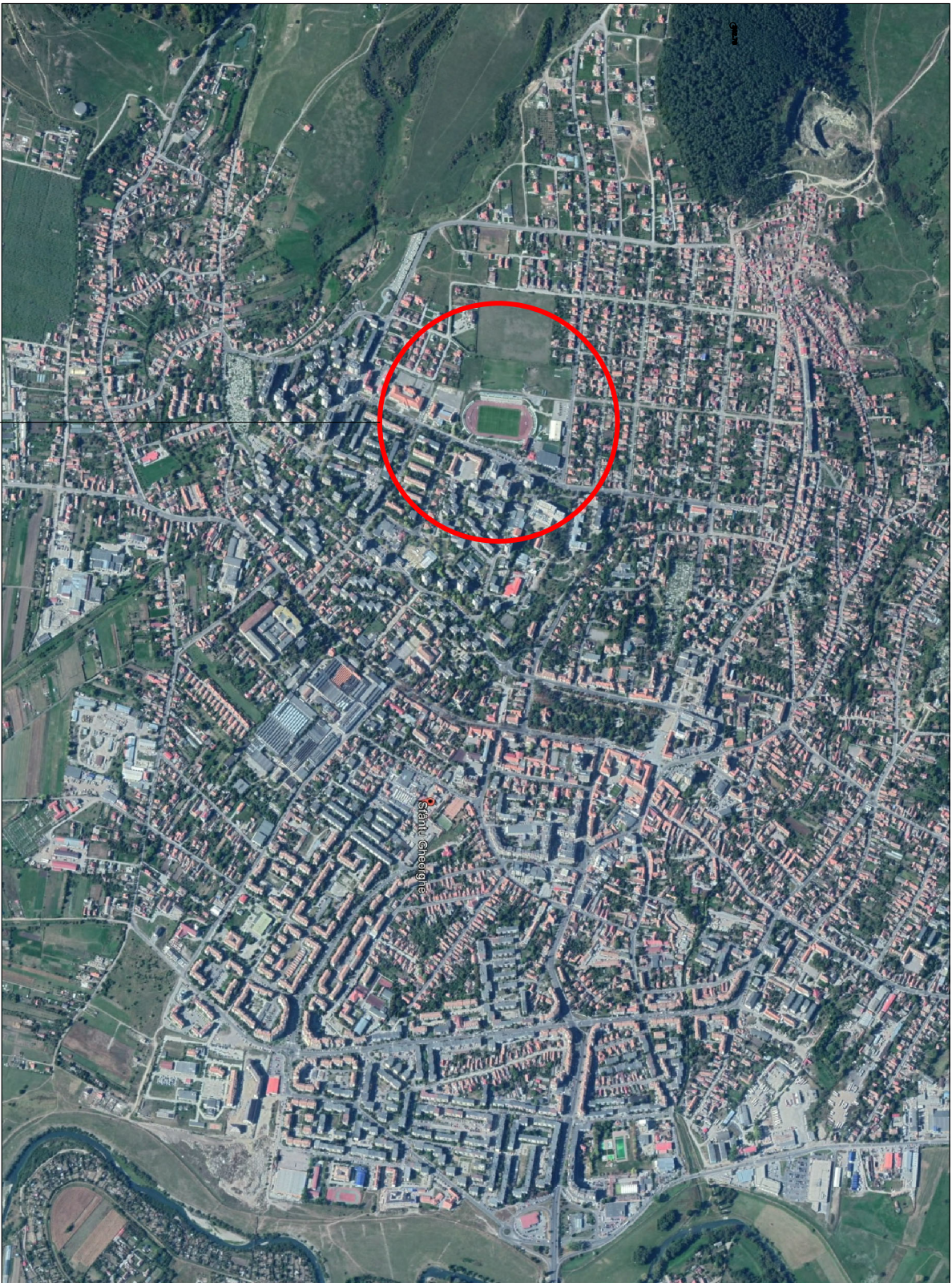
STADION MUNICIPAL SFANTU GHEORGHE